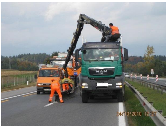
Pomoč delavcev naročnika pri postavitvičasne premične jeklene varnostne ograje na linijo zapore.

Izvajalec je dolžan zagotoviti ustrezno število strokovno usposobljenih voznikov (sposobnost upravljanja z razpisano opremo in vozilom) z morebitno zamenjavo, da zagotovi pričetek dela v zahtevanem roku. Njegovo delo je prevoz, nalaganje in razlaganječasne premične jeklene varnostne ograje. Pri montažičasne premične jeklene varnostne ograje na linijo zapore je izvajalcu v pomoč skupina delavcev naročnika, ki načasne premične jeklene varnostne ograje sami montirajo pokončne smerne deskečasne premične jeklene varnostne ograje, predstavljene na spodnji simbolični sliki.